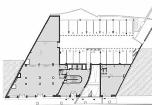
Pôdorys 1. np