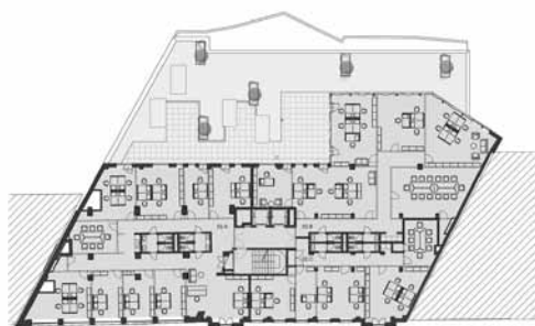
Pôdorys 2. np