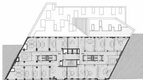
Pôdorys 3. np